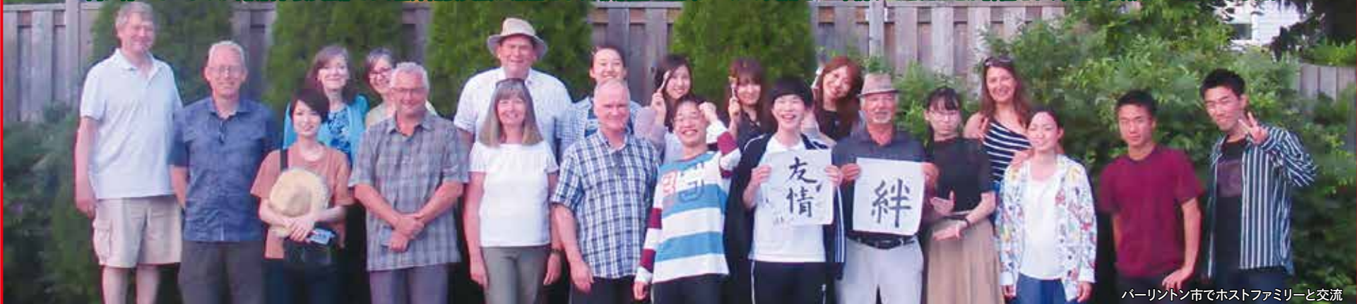
バーリントン市でホストファミリーと交流

板橋区とカナダ・バーリントン市は1989年に姉妹都市提携を締結し、以来、様々な交流が続いています。バーリントン市の組織「世界化委員会板橋小委員会」が令和2年度外務大臣表彰を受賞しました。外務大臣表彰は、日本と諸外国との友好親善関係の増進に多大な貢献をしている個人・団体の中で、特に顕著な功績のあった方々を称えるものです。「世界化委員会」はバーリントン市と海外都市との交流促進を担当している、ボランティア市民などから成る組織で、板橋区との友好交流を専門に行っているのが「板橋小委員会」です。世界化委員会が窓口となり、板橋区と区民レベルの交流を30年続けてきたことが評価され、今回の表彰につながりました。