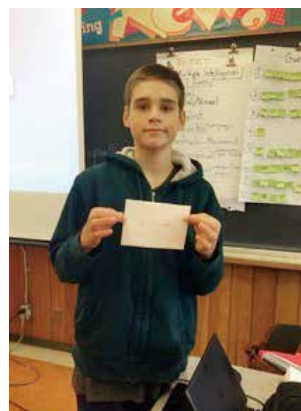
手紙を受け取ったバーリントン市の生徒

バーリントン市 M.M.Robinson 校と区内の高校生が毎年ペアを作り、年に数回、手紙を交換しています。