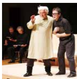
『サアー・ジョン・フォールスタッフ』

act.I「ヴェニスの商人」より 『シャイロック』 act.II「ヘンリー四世」より 『サアー・ジョン・フォールスタッフ』