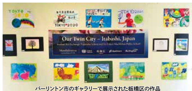
バーリントン市のギャラリーで展示された板橋区作品

2007年にクラークスデール小学校と区立富士見台小学校が、お互いに制作した凧を交換したことをきっかけに始まり、以来、生徒たちの絵や習字などの作品を交換し、展示しています。