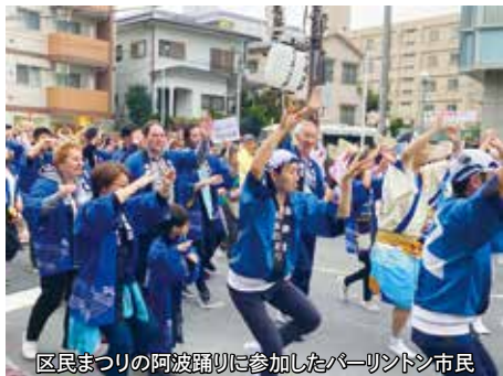
区民まつりの阿波踊りに参加したバーリントン市民

市民・区民訪問団が相互に訪問し、交流しています。2019年には姉妹都市提携30周年記念事業として、板橋区から15歳～23歳の青少年10名がバーリントン市を訪問し、ホームステイや英語研修などを行いました。世界化委員会の委員がホストファミリーとなり、青少年と交流を深めました。また、バーリントン市からは市民16名や世界化委員会の委員が来日し、様々な日本文化の体験と交流を行いました。